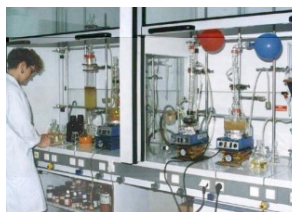
Fabrication par un technicien de nouvelles molécules pour l'industrie pharmaceutique et cosmétique