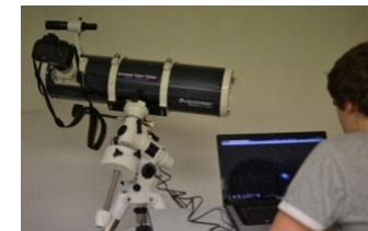
Un élève traitant sur ordinateur une image prise avec un appareil photo branché sur un télescope.

Utilisation des outils informatiques de traitement d'images.